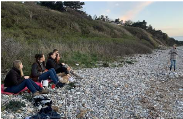
Hygge på stranden ved Sejrøbugten

Alle skolens afdelinger tog på hver deres tre-dages lejrskole i september. Turen gik til feriekolonien Højbjergshus, der ligger i smukke omgivelser i Sejrøbugten. Her blev nye og gamle elever rystet sammen, og der var plads til både mad over bål, kortspil, egentid og gåture i det smukke landskab.