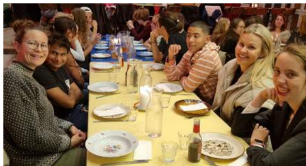
Elev Café m. spisning i Folkehuset Absalon

Hver onsdag kl. 15-19.00 holder vi traditionen tro fælles Elev Café for alle afdelinger. Her tilbyder vi ture ude af huset, temadage eller hyggeaftener hjemme. Vi startede op med skoleårets første café i uge 39, hvor vi var en tur i Valby Vandkulturhus.